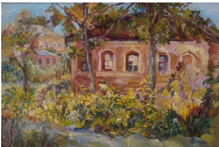
3. Маркова Е.М. Старая ярмарка. 2015 г.