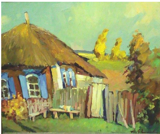
Филиппов А.Г. Хатка из прошлого.