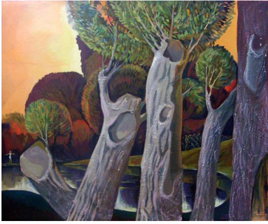
2. Галюзин А.А. Набат. 2014 г.