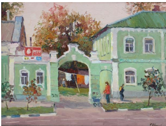
Филиппов А.Г. Улица Ленина. 2009 г