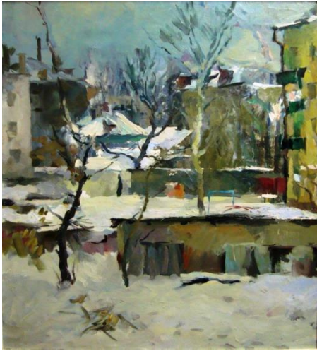
3. Болотов Ю.И. Обычный рейс. 2000 г